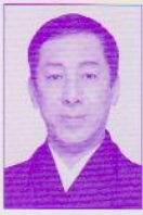
いちかわ もんのすけ 市川門之助