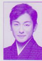
かたおか あいのすけ 片岡愛之助