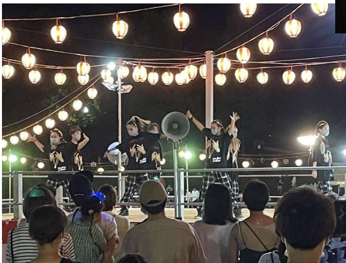
キッズダンス PART3 キレイです