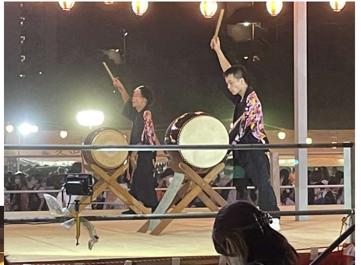
香久山櫓太鼓のみなさん かっこいいですね