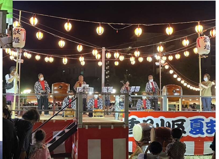
野方お囃子太鼓のみなさん 素敵な音色です