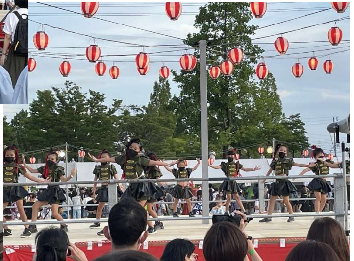
キッズダンスPART2 盛り上がります！