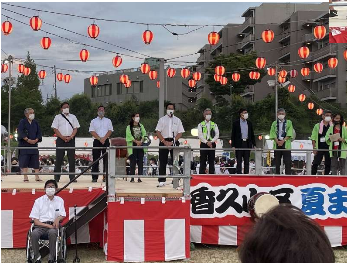
ご来賓の方々 ご挨拶をいただきました