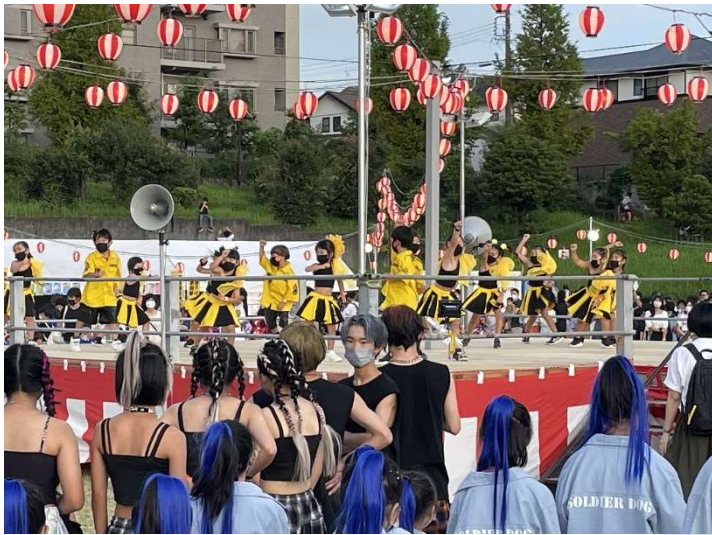
開会の前に カッコ可愛いキッズダンス！