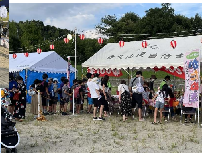
夜店がにぎわい始めました