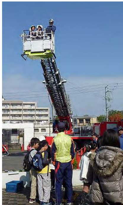
↑「高～い～！」はしご車試乗は、子どもたちの一番人気！

その後、集合場所から香久山小学校へ。合同防災訓練の参加者は、岩崎台区からの参加約250人とスタッフを加え、総勢750人ほどでした。