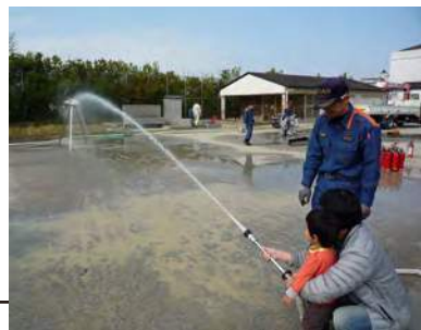
目標めがけて、放水訓練。ばっちり命中！