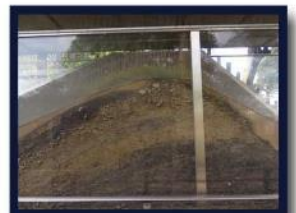
どるい たんめんとん じ しせつ 土塁断面展示施設