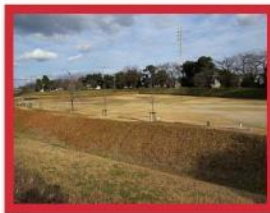
くる わ 曲 輪