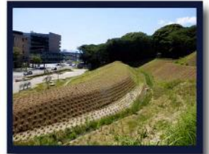
ふく けん どるい ほり 復元した土塁と堀