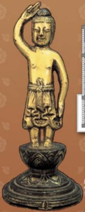
La réplica de la estatua del Nacimiento del Buda de Pie, hecha de cobre y un patrimonio cultural importante del país, se encuentra en exhibición permanentemente.

En la sección del Cerro de Komaki presentan la historia del castillo del cerro de Komaki y su pueblo, así como los resultados de excavación, a través de los paneles explicativos, las réplicas y la exhibición de los objetos excavados. También se encuentra la copia del pozo de tamaño real, descubierto en el castillo del cerro de Komaki. En la sección de la casa de los comerciantes, se reproduce una habitación de los comerciantes de Komaki, en la época del fin del gobierno feudal al principio de la era de Meiji.